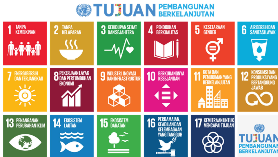
Gambar 2. 1 Tujuan Pembangunan Berkelanjutan (BAPPENAS, 2017)

Keterkaitan Paris agreement dengan SDG's adalah sangat erat karena diakomodirnya perubahan iklim ( Climate Change ) pada salah sasaran dari SDG's meskipun sasaran tercapainya 2DS pada Paris Agreement pada tahun 2050 tetapi SDGs adalah visi dari keadaan dunia secara keseluruhan pada. 2030 seperti yang terlihat pada gambar dibawah ini